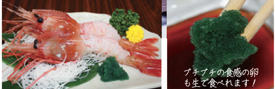
プチプチの食感の卵も生で食べれます!